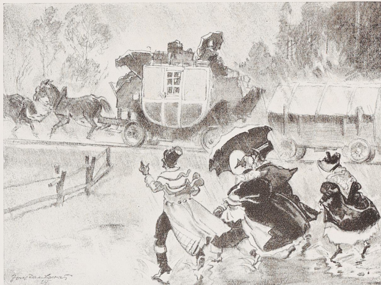
Bild 2. Worin sich Einst und Jetzt auch heute noch gleichen: das Zuspätkommen. Einst: „1 PS : 10 Personen“. Idyll aus den Frühlingstagen der Pferdeisenbahn Budweis—Linz 1832. Zeichnung von Josef Danilowatz, Wien.