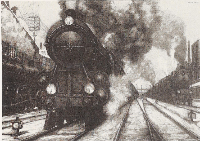
Bild 17. „Lokomotiven“. Aquarell-Pastell von Hans Baluschek, Berlin.