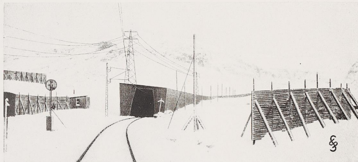
Bild 335. Die Wächter des eisernen Pfades: Schneeschirme und Schneegalerie der schwedischen Riksgränsbahn. Anordnung der Fahr- und Speiseleitung durch die Siemens-Schuckertwerke, Siemensstadt bei Berlin.

Druckstock: Siemens-Schuckertwerke, Siemensstadt bei Berlin.