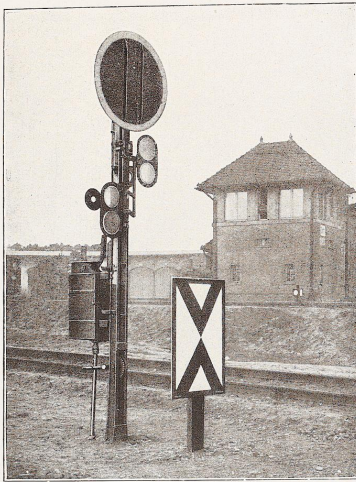
Bild 341. Die Wächter des eisernen Pfades: Einheits-Vor-signal der Deutschen Reichsbahn mit Merktafel. Ausgeführt von Siemens & Halske A.-G., Blockwerk, Siemensstadt bei Berlin.