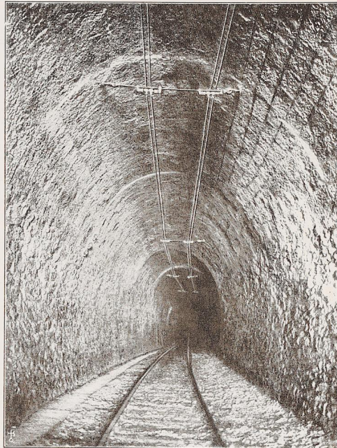
Bild 509. Simplonbahn: Simplontunnel (Bild 499). Blick in das Tunnelinnere vom Führerstand der fahrenden Lokomotive aus.