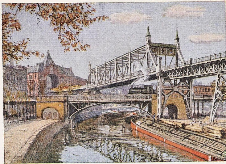
Bild XXIV. Hoch- und Untergrundbahn, Berlin: Strecke Gleisdreieck—Warschauer Brücke. Dreifache Überschneidung von Hochbahn, Anhalter Bahn, Landwehrkanal. Im Hintergrund links Torhaus des Kraftwerkes, die Durchfahrt zur Ostspitze des ehemaligen Gleisdreiecks und jetzigen Kreuzungs-Bahnhofs Gleisdreieck. Nach einem Aquarell von Prof. Fritz Beckert, Dresden.