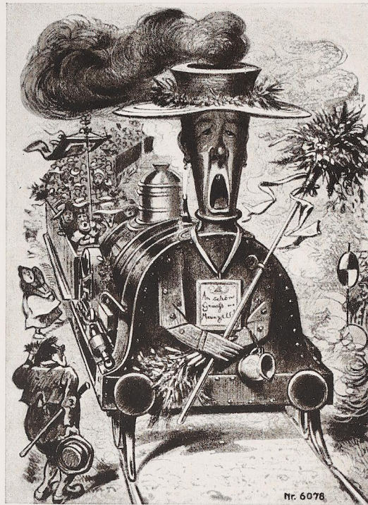
Bild 603. Mariazeller-Bahn St. Pölten-Mariazell. Einst und Jetzt: Das Einst als Zukunftsbild. „Die Mariazeller Wallfahrt zum ersten Male per Dampf“. Karikatur von Stühr im Wiener Figaro vom Jahre 1878. Tatsächliche Eröffnung der Bahn mit Dampfbetrieb 1907, mit elektrischem Einphasen-Wechselstrombetrieb (6500 Volt, 25 Pulse) 1912. Druckstock: Hanomag, Hannover-Linden.