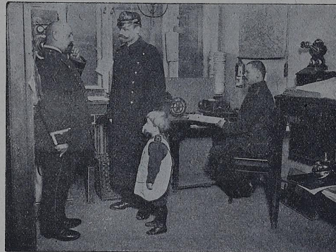
Muna nu pimbedi.

Yetena moto ibi, ni polis ni tem o ni tetena wuma di jiba di bolane no, nde e ben damee mo, na walane mo o ndabwa Polis ny'eboa. Mwena moto na mwena moto nu si soŋtane njea o mudi, Polis e ma laŋgwea mo ponda yese, weni aŋgamen no daŋgwea o mo po o wuma a ma pna no wala, ninka nye nde, yetena nu mwena moto uwele. Lambo na lambo la bobo di bolane te moto o njea, lambo kana ebwan na, o to medi ma mudi, to diŋgudu landa o monya moto bwa mo, to moto nupepe bwa nune na numa la diwendi, manu mambo mese to nje e bolane, Polis nde e ben bole nu moto nu kusi nika nyai a ndutu lomabe o ndabwa maboa diboki, yete kwedi, o ndabwa soŋgo. Yetena mbeti nye na ni yoki o won jita bwambi, nye o njea; Polis nde e ben jame ba bato ba mane y'ewenji na jama pe ba nja ba ta bombwa mo; to nja nu si ma dube doi la ni polis o ponda pula jama la ba bato, yetena e kwadi na bato