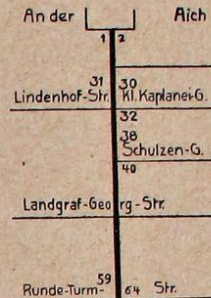
(Lageplan der Großen Kaplaneigasse.)